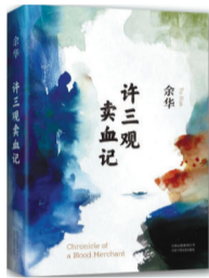
《许三观卖血记》 余华 著 北京十月文艺出版社

人,就是要在不同的年龄段,反复阅读鲁迅的书。越有经历,越有阅历,书中的文字才会更为深刻与精彩。我们不再有书中人那般苦难的生活,但我们避免不了心中的彷徨。若真到人生彷徨时,读一读《彷徨》吧,终是能在文字间获取到一种坚韧的力量。