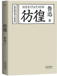
《彷徨》 鲁迅 著 天津人民出版社

年纪尚小时,我们总是喜欢幽默风趣又通俗易懂的书籍作为课外读物,相比起来,鲁迅的文字晦涩难懂,带有强烈的时代特征。若是浅浅阅读,只图个乐没有收获,觉得不大痛快;若是深深品读,没有人讲解,就着那个遥远的时代,又读不通,不胜可惜。所以即使鲁迅名扬中外,我对他的阅读也仅限于中学时期一篇篇课文和阅读题。因此类原因,对于鲁迅,了解的只有书本上的介绍,书却是少有一本能完整阅读完的。