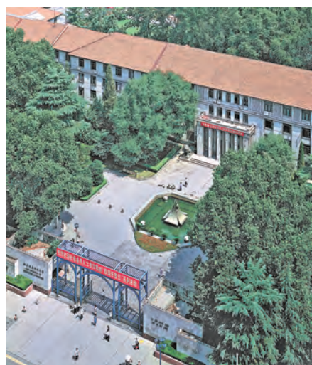
学校雁塔校区历史建筑群入选“第四批中国20世纪建筑遗产名录”