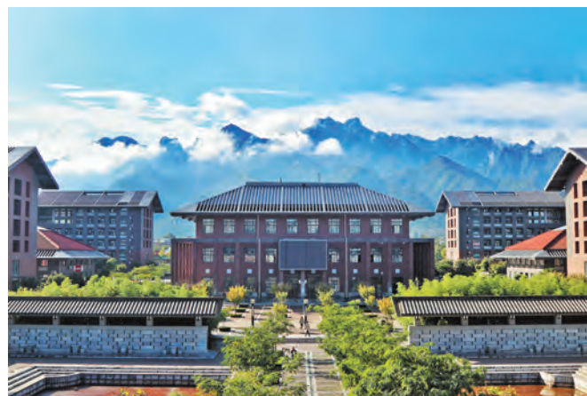
草堂校区南山书院

建设绿色生态校园。 成立节能工作领导小组,制定节能工作实施方案,通过两校区能源指标化管理、开展各类节能改造、提高师生节能意识等途径实现节能目标。学校成功承办全省教育系统节水工作会议并被西安市评为“节水型公共机构”,被陕西省节能协会评为“节能工作先进单位”,被陕西省机关事务服务中心推荐为全国“能效领跑者”示范单位。