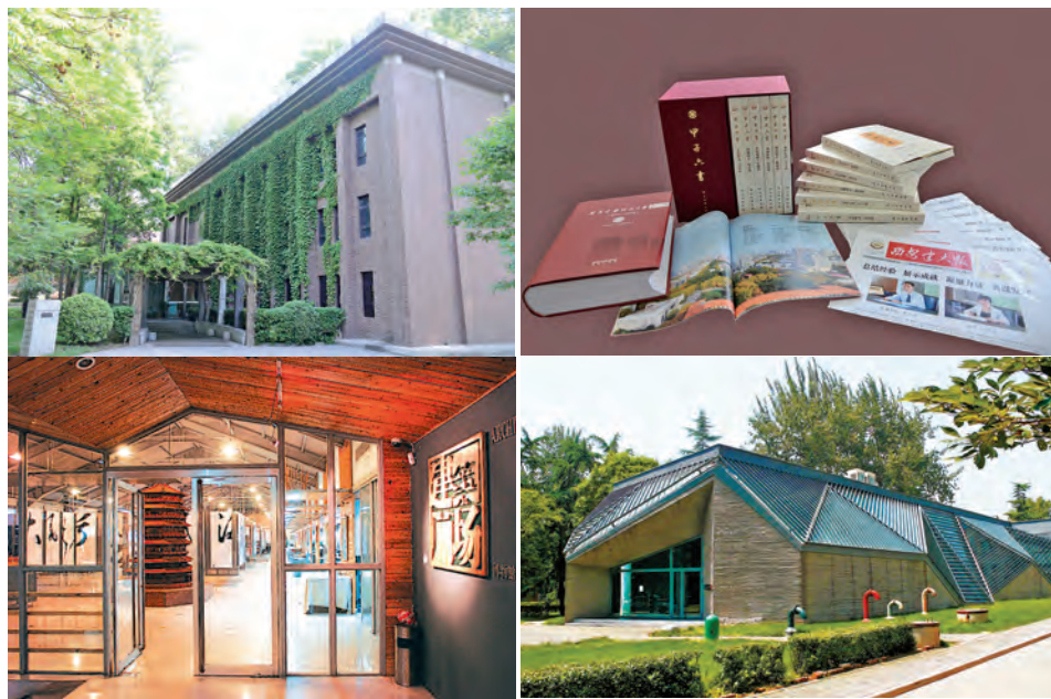
①校史馆 ②部分大学文化丛书 ③建筑广场 ④贾平凹文学艺术馆

创新艺术实践,强化素质教育。 成立艺术与美育教育中心,加大对大学生艺术团、话剧社、民乐团等学生艺术团体指导与支持力度,通过组织参加艺术展演和竞赛交流,深化艺术实践,推动艺术精品不断涌现。毕业生文艺晚会、“我的大学”迎新晚会、“身边的榜样”颁奖典礼、“高雅艺术进校园”等活动深受学生欢迎,成为校园艺术活动品牌。