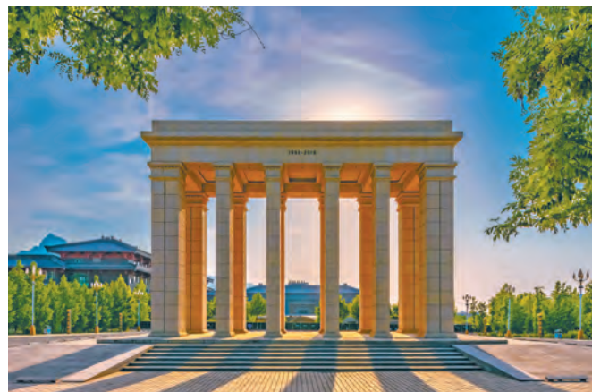
草堂校区校庆标志物