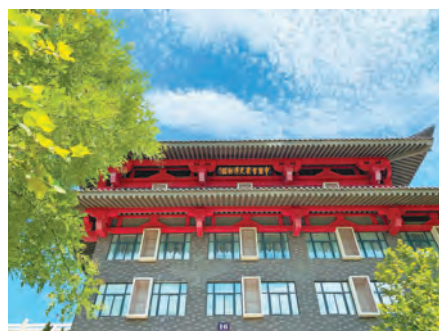
草堂校区学府城(局部)

校园环境是对学生进行潜移默化教育的重要外在因素。学校积极营造优美的校园环境,促进学生健康成长。雁塔校区以西大门至工科楼为景观轴线,源园、学海园、安仁园、树人园、双百园等五园衔接紧密而风格各异,成就了大学校园之美好园林。草堂校区吸收唐长安城“城中设坊,坊内布置院落,院落中安排房间”的“九宫格”式传统规划元素,以草堂学府城为核心,连带南山、紫阁两座书院,表现了汉唐建筑的文化风韵。