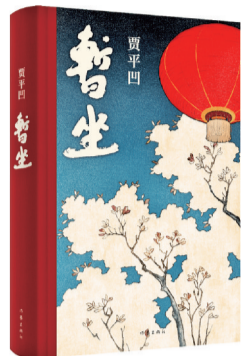
《暂坐》 贾平凹 著 作家出版社

贾平凹于当代文学一直是生命蓬勃的。创作初期,当整个文坛还在擦去“伤痕”,在新诗掀起的小高潮里“浪漫”的时候,他却未师承当下,而是直通中国传统文脉,活泼泼让“满月儿”笑成了蒲松龄笔下的婴宁。随着距离拉开,当人们都在以关照的目光聚焦家族史、民族秘史的时候,他却“不合时宜”地讲着他的山匪与山民的故事,在陕南一隅构建着自己的文学故乡。