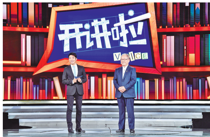
刘加平院士做客央视《开讲啦》栏目揭秘乡村振兴中的“绿色密码”

学校大力推动各类文化全面发展，营造积极健康、向上向善的浓郁文化氛围，让广大师生在春风化雨中感受文化滋养。以学术文化助力内涵式发展，开展“建树讲堂”“圭峰讲座”，邀请专家学者、文化名人、杰出校友等来校作报告，举办丝路国际建筑科技大会等搭建学术交流平台，学生在“挑战杯”、IFLA等国内外竞赛中屡获大奖，成绩斐然。