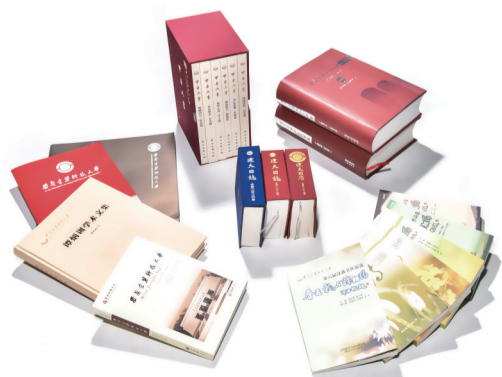
学校部分文化丛书