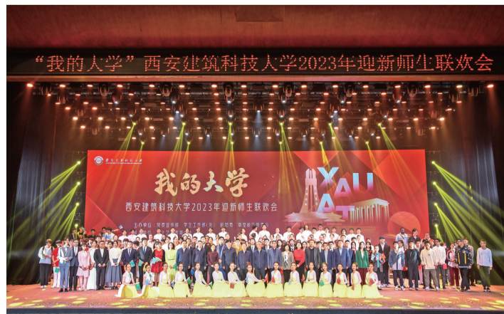
学校举办“我的大学”迎新师生联欢会