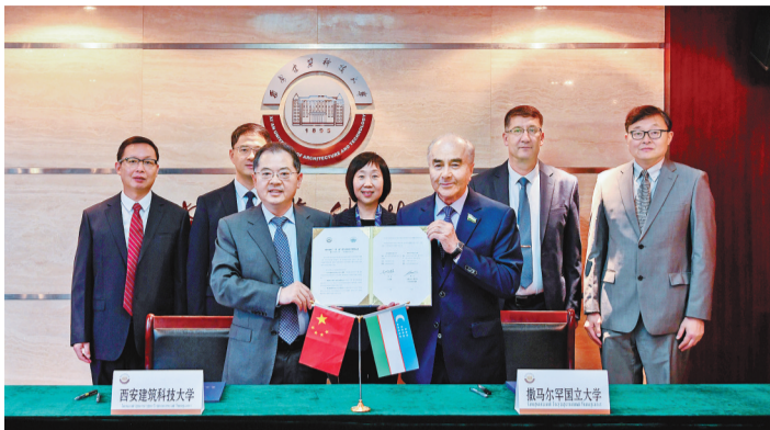
学校与乌兹别克斯坦撒马尔罕国立大学签署共建绿色建筑“一带一路”联合实验室备忘录。

学校结合我国西北地区与中亚国家环境气候、资源禀赋相近等特点,聚焦丝路沿线城镇化建